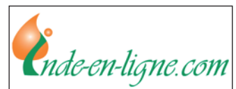
Portail de l'Inde en France